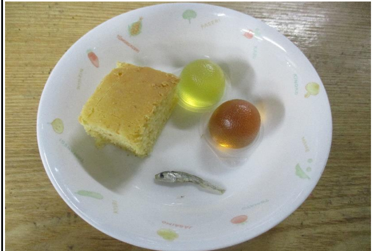
【おやつ:以上児】セサミキャロットケーキ・炒りじゃこ・ミニゼリー