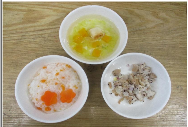
【離乳食】人参ごはん・豚肉のゆかり焼き・ふのお吸い物