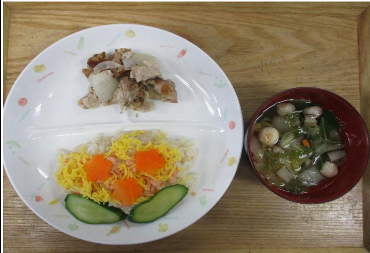
【普通食:以上児】あじさいちらし寿司・豚肉のゆかり焼き・手毬麩のお吸い物

今日は昆布についてです。昆布だしはグルタミン酸などのうま味成分を多く含んでいます。味の特徴は上品で控えめなうま味があり、素材の味わいを大切にする料理に向いています。